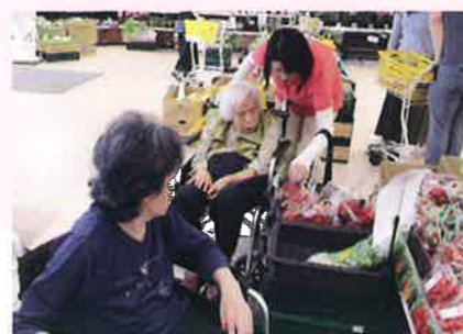
お花見、買い物、ドライブ等の外出もできます。近くのコンビニエンスストアまで車いすや歩いて買い物に行くこともできます。