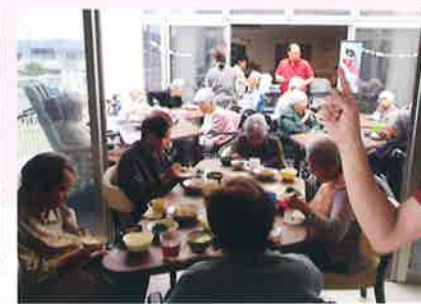
天気の良い日は屋外デッキにサンシェードを張ってランチをいただきます。頬にあたる風がくすぐりたいです。