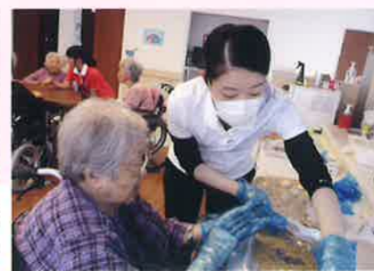
餡を丸めたり生地で包んだり、「まだできる」の喜びは次の挑戦に繋がっています。この日は「ごま団子」美味しくできました。