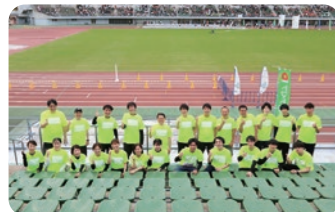
10月 岡山リレーマラソン