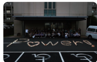
7月 キャンドルナイト