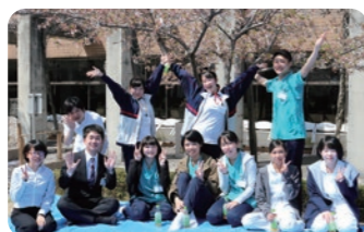
4月 新入職員お花ランチ